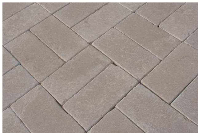
Esempio pavimento realizzato con 20x40 burattato (doppio senso).