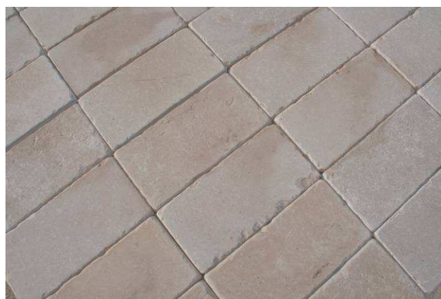
Esempio pavimento realizzato con 20x40 burattato (unico senso).