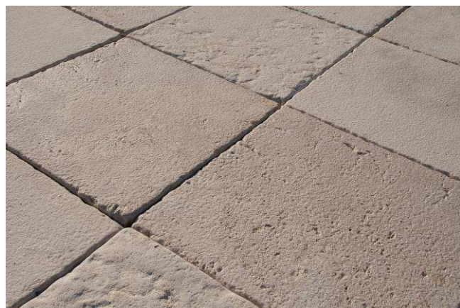
Esempio pavimento realizzato con 40x40 bocciardato e burattato.